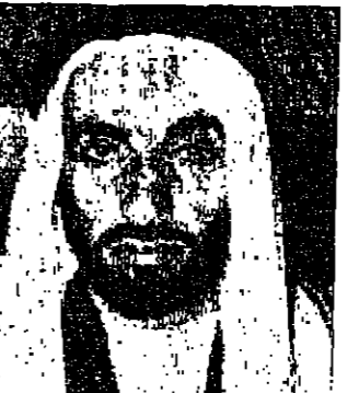
تبرع ابو ظبي لمنظمة فتح